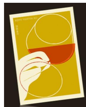
羽田圭介オリジナル短編小説