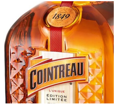
(ボトル表面クローズアップ)