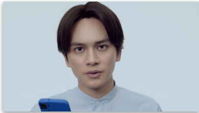
北村さんセリフ 「転職サイトと エージェントって どっちが使いやすいの？」