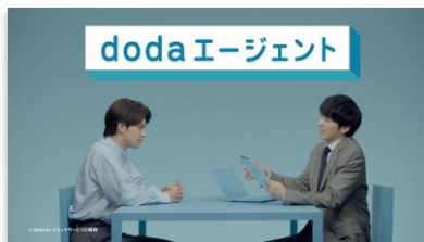
【NA】 dodaなら 転職のプロが