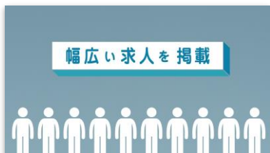
【NA】 だからdodaは 2人に