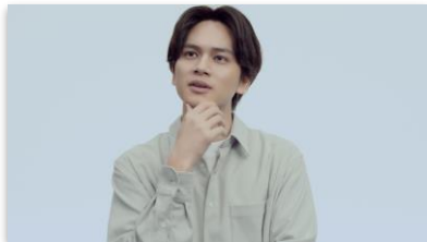
北村さんセリフ 「転職サービスって どこがいいんだろう？」