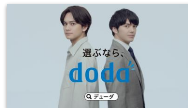
【SL】 選ぶなら、 doda