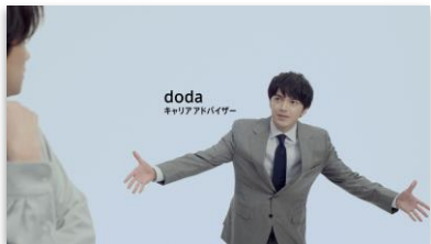
林さんセリフ 「求人数が 多い方が選択肢が 広がります」