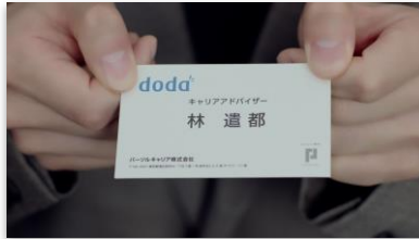
林さんセリフ 「なんでも相談 してくださいっ！」