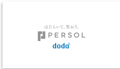
【NA】 はたらいて、笑おう。 パーソル