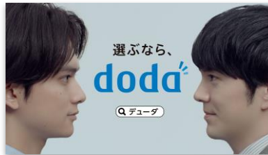
【SL】 選ぶなら、 doda