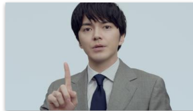
林さんセリフ 「2人に1人！」