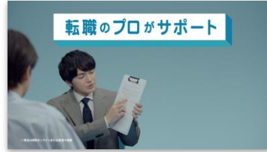
【NA】 あなたの活動を しっかりサポート