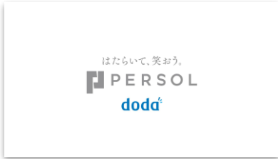
【NA】 はたらいて、笑おう。 パーソル