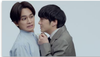
北村さんセリフ 「近い…」 林さんセリフ 「相談してください」