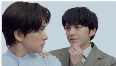
林さんセリフ 「だったら エージェントに 相談できます！」