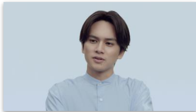
北村さんセリフ 「転職したいけど どうしたら…」