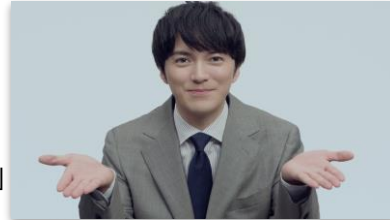
林さんセリフ 「どっちも使える！」