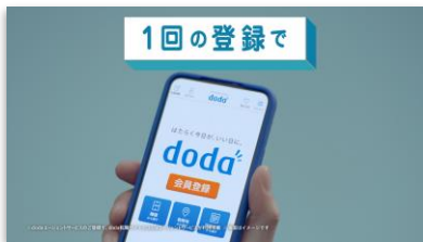
【NA】 dodaなら一回の登録で