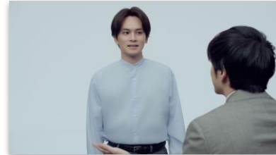
北村さんセリフ 「楽しそうですね」