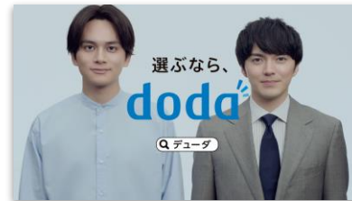
【SL】 選ぶなら、 doda