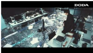
「もっとのびのび泳ぎたい」