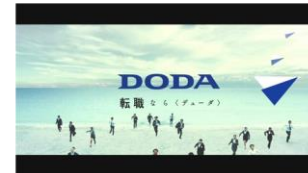
「転職なら<デュエダ>」