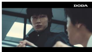
「キミは、どこへだって行ける」