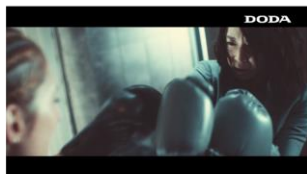
「こんなに頑張ってるのに」