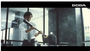
「もっと勝負したい」