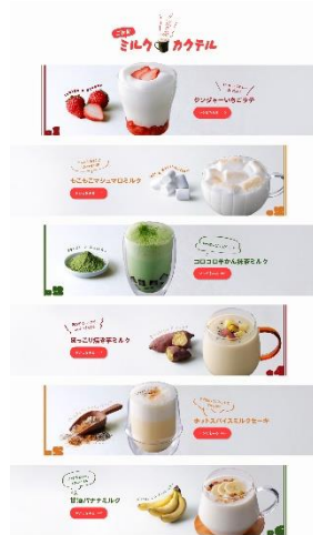
アレンジレシピ (ご自愛ミルクカクテル)

「冬のご自愛ミルク」特設サイトに掲載の北海道産牛乳をふんだんに使用した冬のご自愛アレンジミルクレシピの一部を MILKLAND HOKKAIDO → TOKYO にて期間限定で提供予定。詳しくは、MILKLAND HOKKAIDO → TOKYO の公式 HP・SNS 等にて後日情報公開いたします。