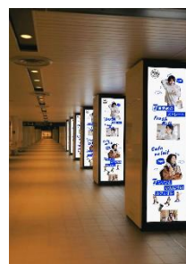
〈メインビジュアル〉