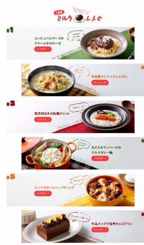
アレンジレシピ (ご自愛ミルクレシピ)