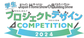
「学生プロジェクトデザインコンペティション」ロゴマーク

プロジェクトデザインは社会問題に対して、前提条件からデザインを行い問題解決を行うことです。どの地域でどのような人を巻き込んだら何ができるようになるのかなど、問題提起から敷地、用途、運営主体まで自ら設定し、それらの条件をデザインで解決します。