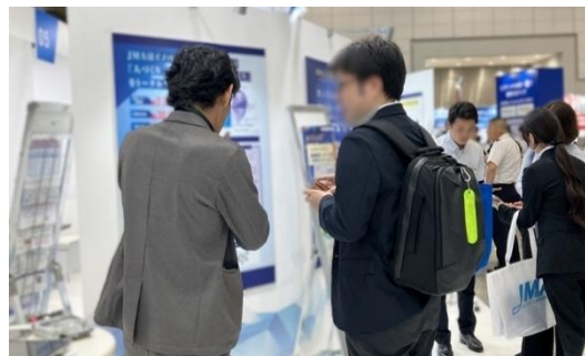
「自律・自走人材の育成」の説明を聞く来場者

社員一人ひとりが変化に柔軟に対応し、自ら成長し続けるための人材育成戦略が、企業の成長と存続に欠かせないと言っても過言ではありません。