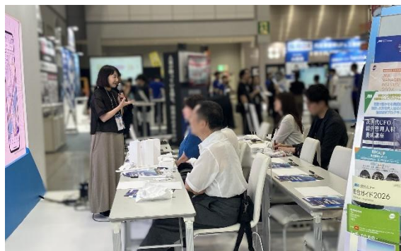
好評だった「アート思考」ワークショップの様子

受講者からは、「実際に身体を動かしてみて、アート思考がどういうものか理解できた」といった声が多く聞かれ、好評でした。