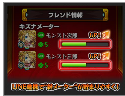
(3) LINE の友だちと遊ぶと“キズナメーター”が貯まりやすく！

LINE との連携方法など、詳細はモンスト公式サイト( https://www.monster-strike.com/ )の「お知らせ」をご確認ください。