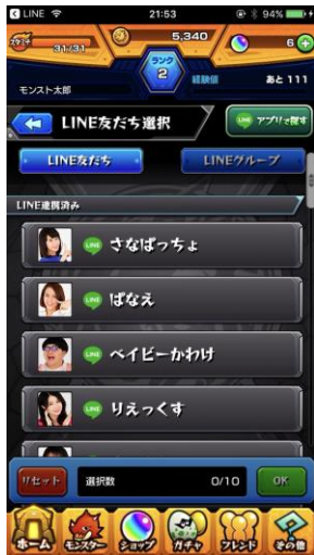
(1) LINE での協力プレイの募集がもっと簡単に！

モンストでフレンドになっている LINE の友だちと協力プレイをすると、“キズナメーター”がより貯まりやすくなります(お互いが LINE 連携をしている場合のみ有効です)。“キズナメーター”が最大値になると、ゲーム内で使用できるアイテムを入手できます。