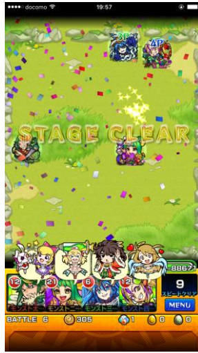
(2) モンストの“グッツジョブ”演出がリッチに！