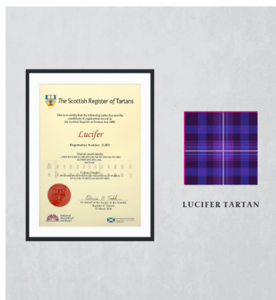
(画像左) 「Lucifer」タータン登録証明書

なお「ルシファータータン」は、タータンの伝統を持つスコットランドの政府行政機関であるタータン登記所(The Scottish Register of Tartans)に、名称「Lucifer」として2018年3月12日(月)に正式に認定・登録されました。