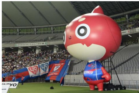
スタジアム内に登場した 10mオラゴン