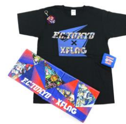
FC 東京×XFLAG コラボグッズ

アジパンダ広場の「青赤横丁」にて行われた「XFLAG 夏祭り」では、FC 東京のチームカラーとモンスターのキャラクターで装飾されたやぐらや、子供が楽しめる縁日ブースが設置されたほか、限定キャラクターが入手可能な特別クエストを体験できる「STRIKE CHANCE」が登場。会場ではモンスターの人気キャラクターと東京ドロンパのグリーティングも行われ、子供たちは笑顔でキャラクターとの触れ合いを楽しみました。また、同会場内では、FC 東京とのコラボ商品を販売する「XFLAG STORE 出張販売所」を出店。この日しか購入できない限定グッズが手に入るとだけあって、ブース前は長蛇の列となり、購入したばかりのグッズを早速身に付けてイベントを楽しむファンの姿もありました。