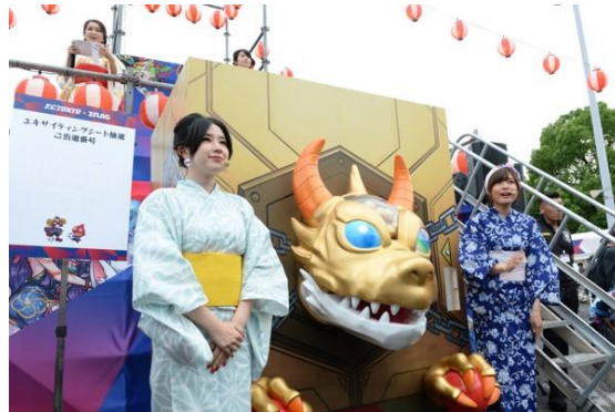
リアルガチャリドラを使っでの抽選の様子

今回の冠マッチでは、臨場感たっぷりのピッチサイドで観戦をできる「XFLAG エキサイティングシート」が 25 組 50 名限定で登場し、当日「XFLAG 夏祭り」にて、その抽選会が行われました。抽選会には FC 東京サポーターはもちろん、多くのモンスターファンも詰めかけ、イベント会場はこの日一番の盛り上がり。超プレミアムチケットを手にした当選者は、選手たちの熱気を間近に感じながら、身を乗り出して試合を観戦し、通常のマッチデーにはない特別な体験に、興奮が冷めやらないまま会場を後にしました。