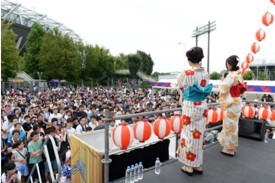
「XFLAG エキサイティングシート」抽選会