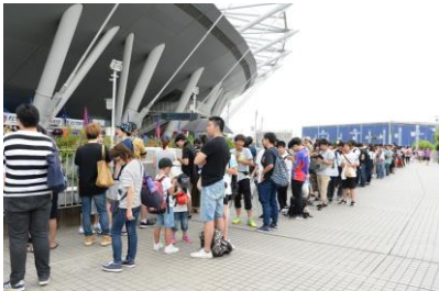
XFLAG Day チケット専用ゲート