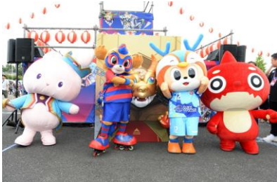
キャラクターによるグリーティング