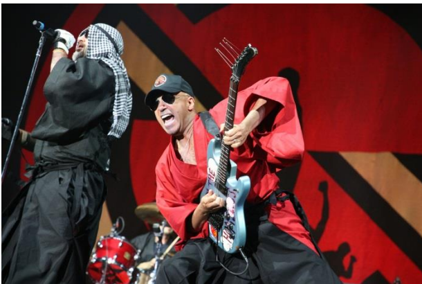
PROPHETS OF RAGE

さらに翌日の4月1日(日)はヘッドライナーの『PROPHETS OF RAGE』、『PENNYWISE』、『ZEBRAHEAD』らが出演し会場を沸かせました。