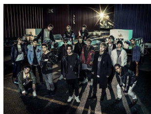
THE RAMPAGE from EXILE TRIBE