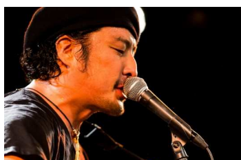
若旦那 (湘南乃風/ the WAKADANNA BAND)

・8/5(土) 若旦那(湘南乃風/the WAKADANNA BAND)、DAISHI DANCE、TJO