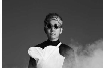
☆Taku Takahashi (m-flo)