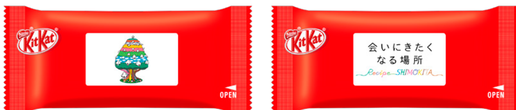
「この日の木」オリジナル「キットカット」