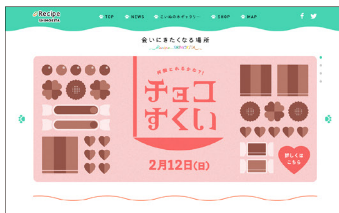
レシピシモキタWEBサイト