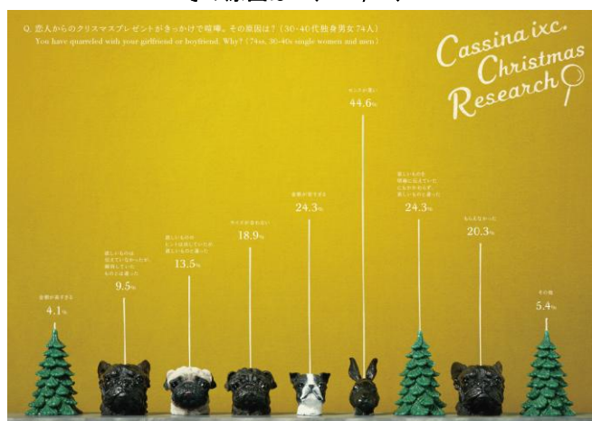
Graph6. 恋人からのクリスマスプレゼントがきっかけで喧嘩。その原因は？(n=74,MA)