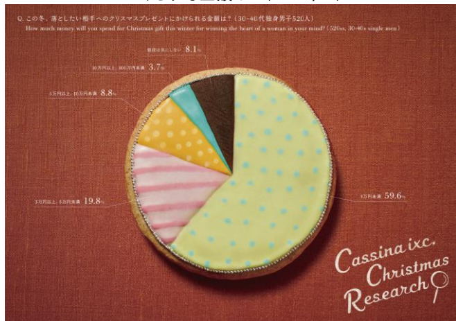
Graph4. この冬、落としたいと相手へのクリスマスプレゼントにかけられる金額は？(n=520,SA)