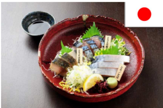
人気№1 とろさばトリオの盛合せ