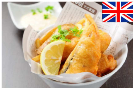
SABARのフィッシュ&チップス