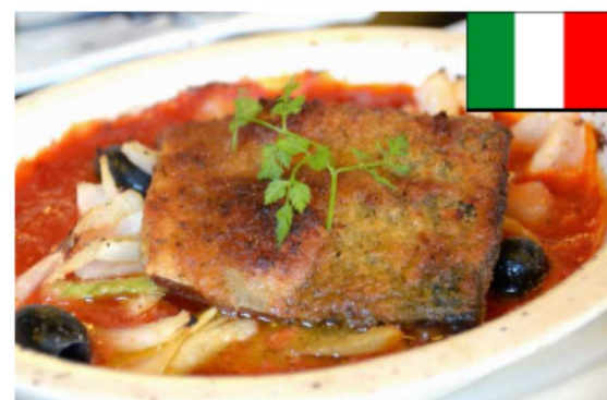
ポーノ! サバーノ! トマト煮ーノ