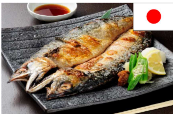
メガとろさばの丸ごと塩焼き