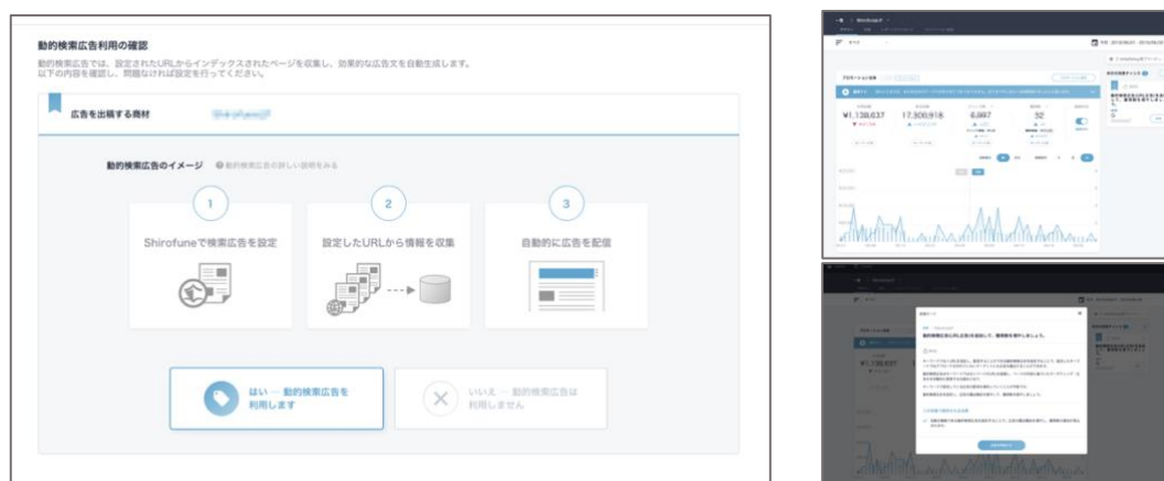
左：DSA 改善カードの設定画面 右上：改善カード表示 右下：改善カードの詳細

リスティング広告・ディスプレイ広告の自動運用ツール「Shirofune」は、広告作成に関する新機能として、これまでは入札・レポートのみに対応していた Google 動的検索広告（DSA）の、新規設定機能を追加しました。