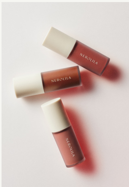
画像上から:シアーレッド、シアーブラウン、ロージーベージュ

ユズ、ナツミカン果皮油、シナモン、クローブ、唐辛子等の柑橘とスパイスを独自にブレンドし、唇をふっくらプランプさせ、やわらかいハリと艶を与えるリッププランパー。カカオやシナモンなどの甘くスパイシーな香りで、恋をしているときのような高揚感をもたらします。