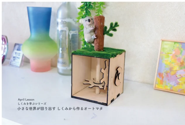
4月生徒向けレッスン