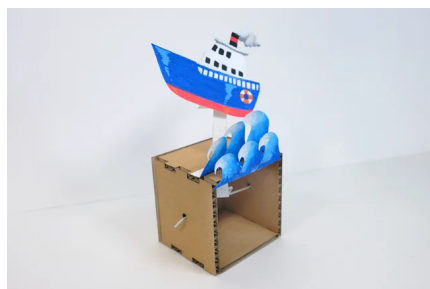
荒波に立ち向かう船