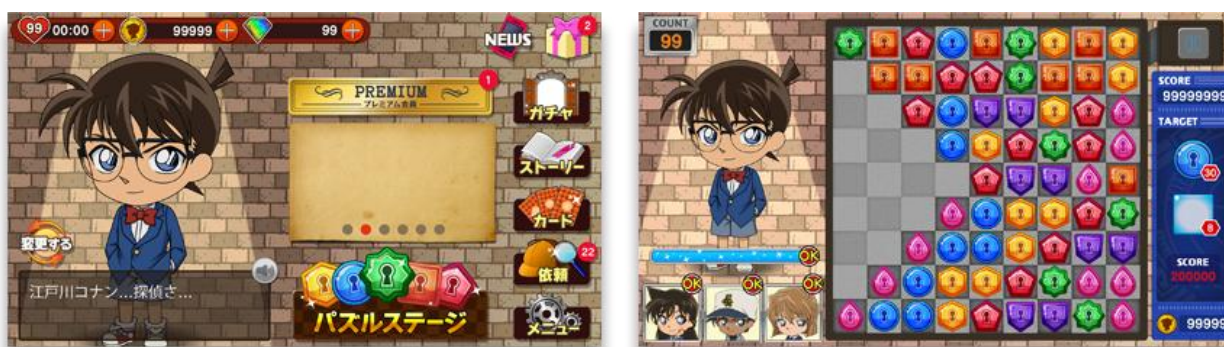
▲マイページ画面（左）、パズルステージ画面（右）