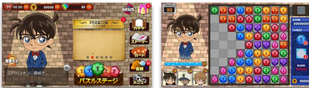
▲マイページ画面（左）、パズルステージ画面（右）