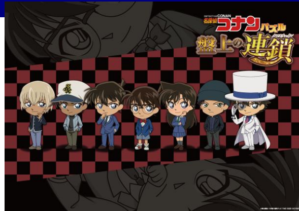
▲オリジナルポスター (イメージ画像)

本アプリに登場する可愛いデフォルメキャラが描かれた B2 サイズのオリジナルポスター。