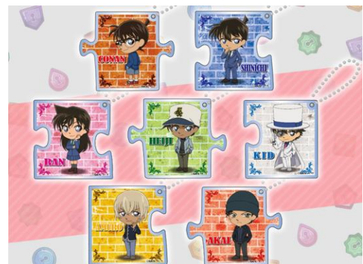
▲リザルト画面 (左) アクリルキーホルダー (右) サンプル画像