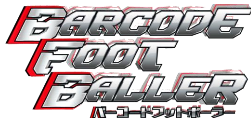
▲『バーコードフットボーラー』ロゴ