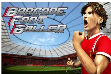
▲『バーコードフットボーラー』メインビジュアル