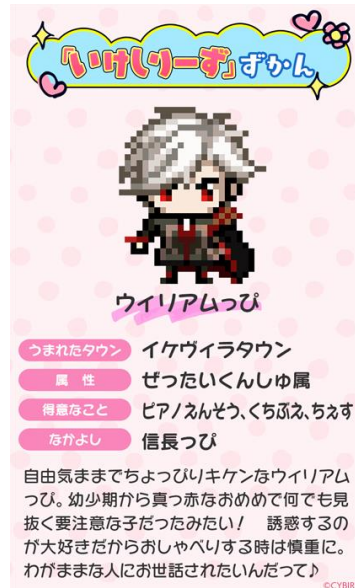
▲「ウイリアムつび」のプロフィール

また『いけしりーず』公式サイト上の端末では、24 キャラクターの中からランダムで『いけしりーず』が誕生し、「おはなし」を通じて実際にふれあうことができます。「おはなし」では、可愛い見た目からは想像できないような甘いセリフをしゃべってくれることも。さらに、仲良しの『いけしりーず』をあなたに紹介してくれます。ぜひ 24 キャラクター全員とふれあってみてください。