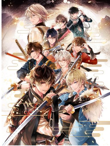
イケメン戦国 時をかける恋-永縁-