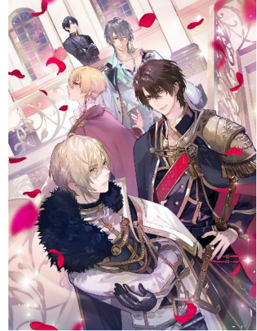
イケメン王子 美女と野獣の最後の恋