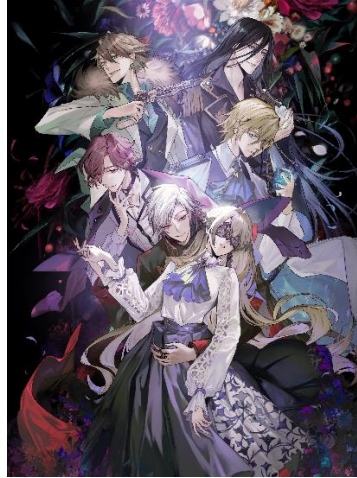
イケメンヴァン 闇夜にひらく悪の恋