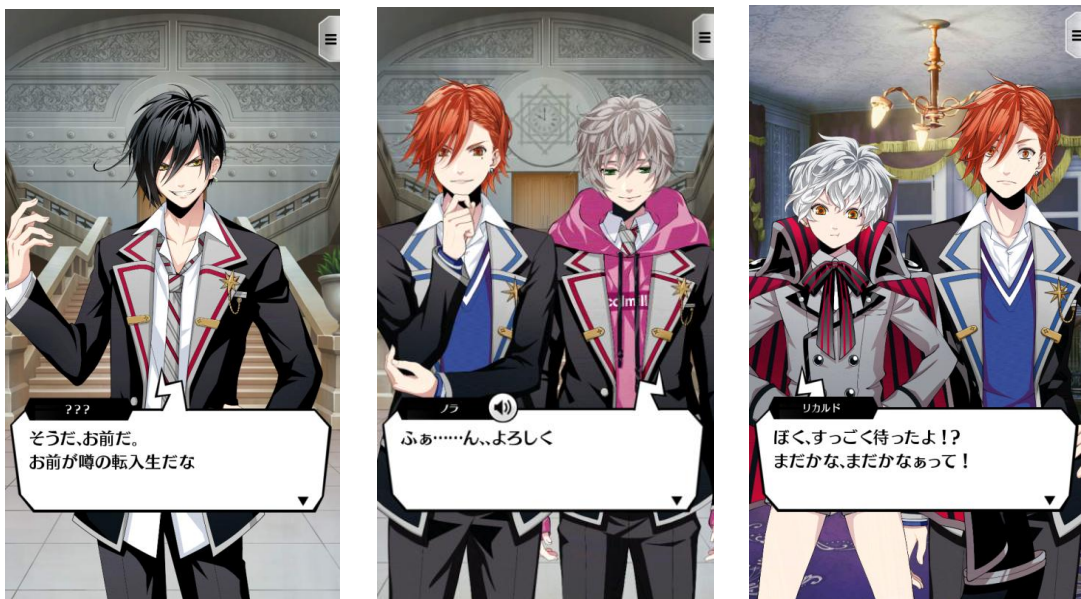
※画面は開発中のものです

総勢 30名の魔法使いたちが、魔法学園を舞台に、青春ストーリーを繰り広げます。江口拓也さん、KENNさんなど豪華声優陣が集結し、300種類以上の収録ボイスもお楽しみいただけます。