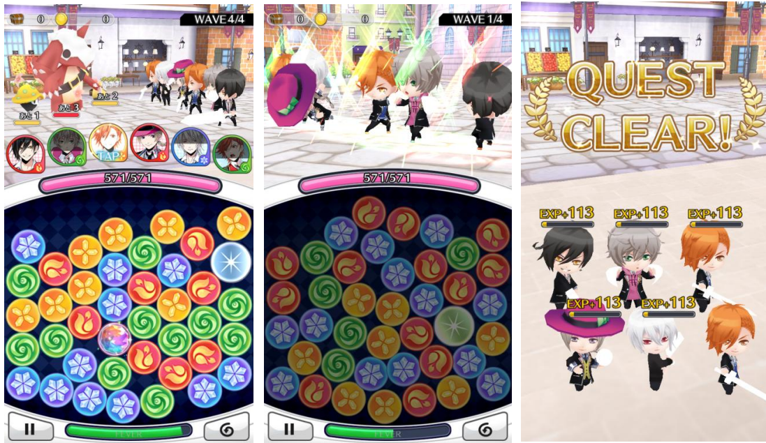
▲3Dのミニキャラになったキャラクターたちが、可愛くバトル! ※画面は開発中のものです

3つ以上のドロップを繋げて、魔力を送り敵を倒す簡単操作の爽快パズルアクションを搭載しています。制限時間内にたくさん繋げてコンボを狙うと、キャラクター達が応えてくれたり、キャラクター同士の特別な組み合わせでユニットスキルが発動したりします。