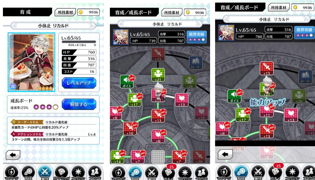
※画面は開発中のものです

成長ボードを開放すると、魔法使いたちを強化することができます。強化することでキャラクターのことがさ らによく分かるスペシャルストーリーや、ボイスがもらえます。