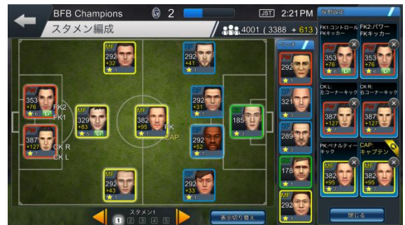
▲「役割選択」画面イメージ

チームの「キャプテン」や、「フリーキック」、「コーナーキック」を蹴る選手を選択できる「役割選択」が登場します。選手を「キャプテン」に設定すると、その選手の「キャプテンシー」の数値によって、「チーム戦術力」が向上します。また、「フリーキック」や「コーナーキック」の役割に設定した選手は、それぞれのシーンで必ず登場します。役割を選択することで、戦術の幅が広がり、より監督力が求められるようになります。