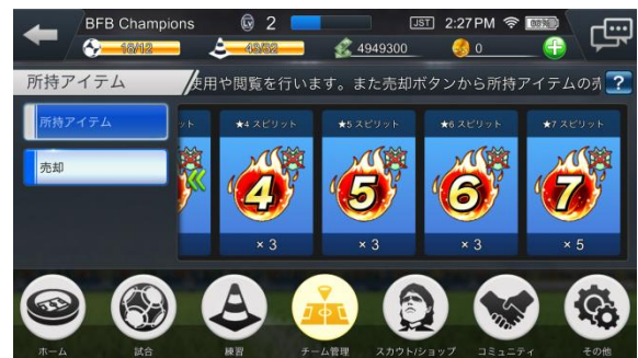
▲「限界突破」画面イメージ