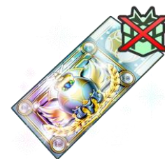
▲「マイプレミアムスカウトチケット」