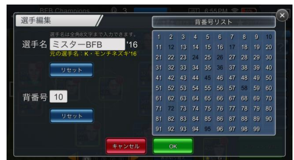
▲「選手名・背番号設定」画面イメージ

選手の名前を自由に変更することが可能になります。また、スタメン、ベンチ、リザーブの選手に1～99までの好きな背番号を設定できるようになります。細部までこだわった自分だけのチーム作りをお楽しみいただけるようになります。