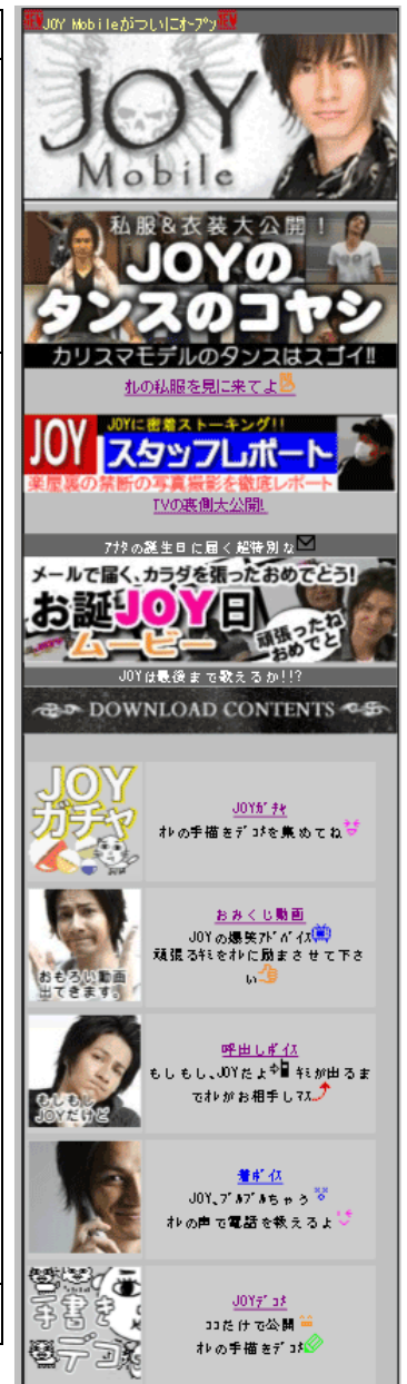
▲サイト TOP 画面イメージ