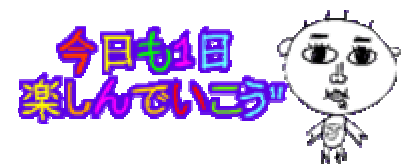
▲ “JOY”本人の手描きのデコメ®