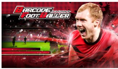
▲『スコールズ』選手バージョンタイトル画像