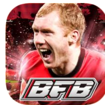
▲『スコールズ』選手バージョン アプリアイコン