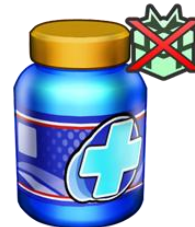
▲「マイトレーニングサプリ」

●期間(日本時間): 2016年7月16日(土) 4:00~7月25日(月) 3:59