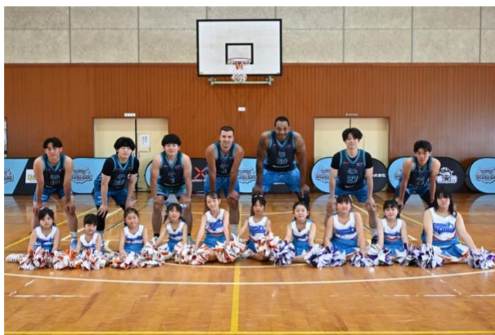
出陣式での集合写真(前列は専属チアダンスチーム「OTAKI CLARUS」)

同チームは「大多喜町のヒーローになる」をテーマに掲げ、選手が農業事業にも携わりながら競技活動を行う「デュアルキャリア型」のチームです。選手として試合に出場する一方、農林業への従事や地域イベントへのイベント参加など、スポーツを通じた地域活性化に取り組んでいます。