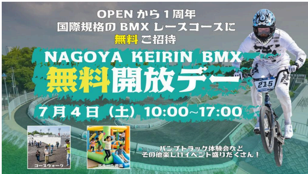
NAGOYA KEIRIN BMX 1周年感謝祭！無料開放デー

2025年8月31日の一般利用開始からまもなく1周年を迎えるにあたり、これまでご来場いただいた皆さまへの感謝を込めて実施するものです。当日は、一定の参加条件を満たす方を対象に、コース利用料を無料とするほか、普段は立ち入ることのできないBMXレースコースを歩く「コースウォーク」、パンプトラック体験会、バルーン遊具など、ご家族やご友人と楽しめる企画を実施します。