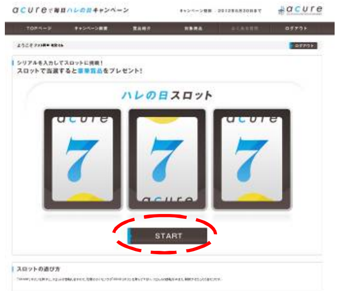
図 4: 抽選ゲーム画面