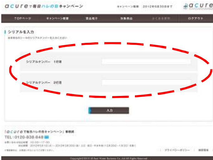
図 3: シリアルナンバー登録画面