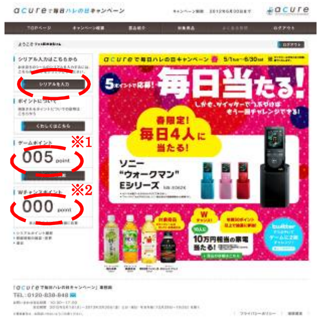
図 2: マイページトップ画面