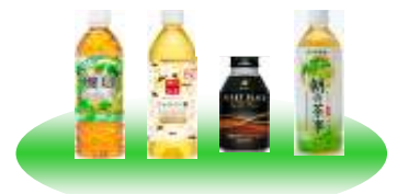
対象商品 (acureお勤めの飲料)