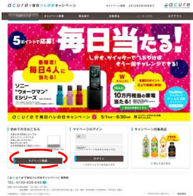
図 1: キャンペーントップページ画面