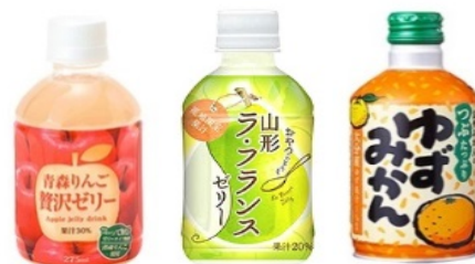
過去、ご好評いただいた食感系果汁飲料

エキナカ自販機では午後の小腹満たし需要に適した カテゴリーである果汁飲料がよく売れます。 その中でも「果肉」や「固形物」が入った食感系が好評で、 今回はその代表格であるゼリー飲料で新しい価値を お届けしたいとの思いから新商品開発がスタート。