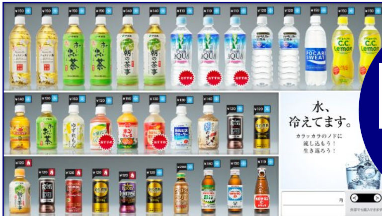
「おすすめ」マークの例