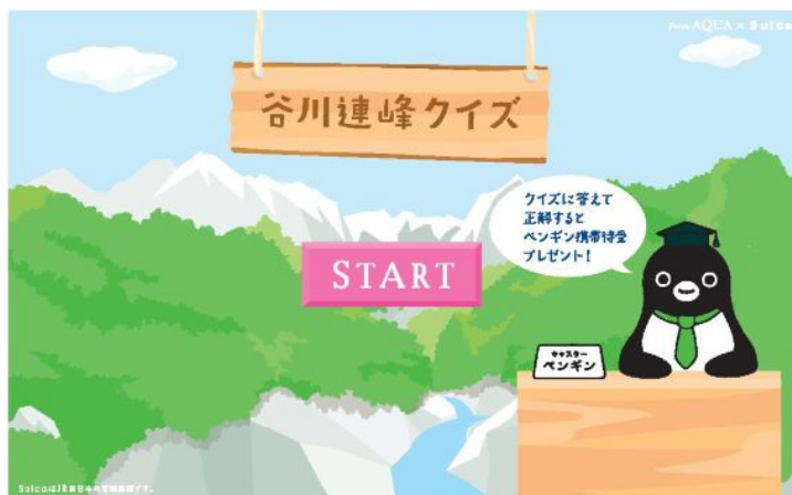
【来場者限定クイズ画面イメージ】

「mediacure」内部のタッチパネルで、クイズに答えて、ぜひGetしてください！