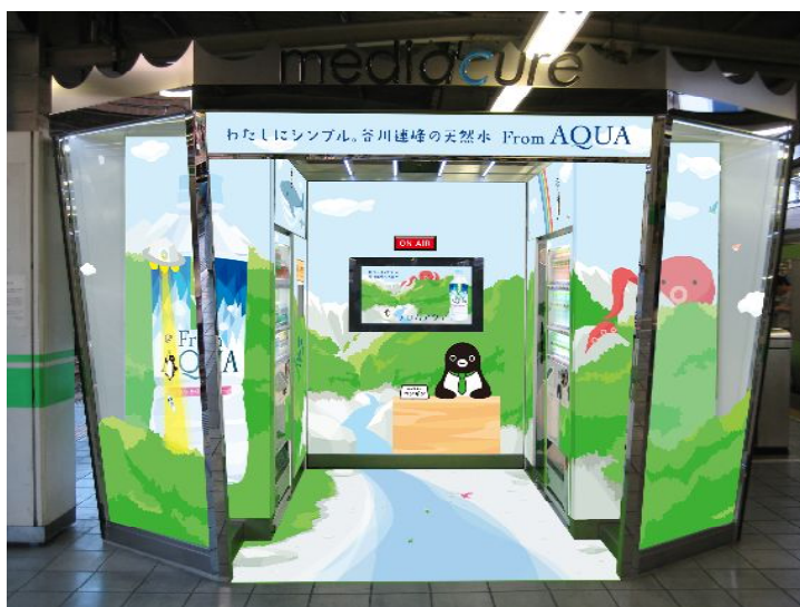
【池袋駅「mediacure」装飾イメージ】

「mediacure」の内部・外部のモニターでは、限定コンテンツ“谷川連峰レポート”を放映し、採水地である谷川連峰の美しさを、映像を通じて表現します。