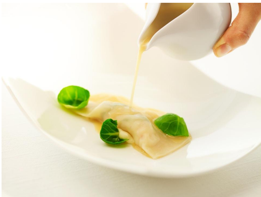
桂 有紀乃がつくる料理 (一例) 「ラングスティース ココナッツオイルのラビオリ、海老のブイヨン、カレーア」

桂は「食事で心と体が元気になる」を基本理念に、翌日も体に負担にならないバランスで、前菜からデザートまで心と味覚で喜んでいただくことを意識したメニューをお楽しみいただけます。