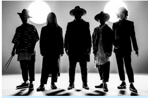
SOIL& "PIMP" SESSIONS(初登場)