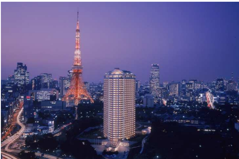
芝公園の緑と都心の眺望が広がるロケーションを活かし、ホテル内の各所でライブを開催するザ・プリンス パークタワー東京 (外観)

また、 限定ミッドナイトライブを鑑賞いただける宿泊セットプラン など、お好みのスタイルでお楽しみいただけるよう全4種のチケットプランをご用意し、ホテルならではの音楽フェスを開催いたします。