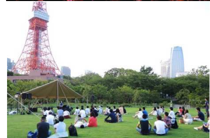
昨年開催時の模様 (上)バンケットルームでの模様 (下)ホテル屋外庭園での模様

©本件に関する報道各位からのお問合せは ザ・プリンス パークタワー東京 マーケティング戦略 広報担当 TEL: 03-5400-1180(直通) FAX: 03-5400-1174 http://www.princehotels.co.jp/parktower/