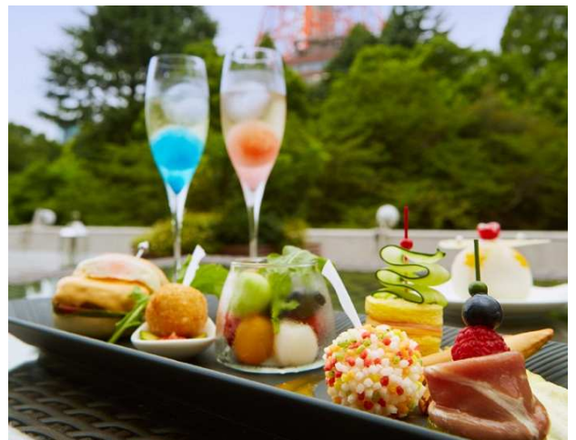
一口サイズのまるい形のメニューやドリンクでそろえた 女子会メニュー「Moon Night Party」(イメージ)

©本件に関する報道各位からのお問合せは 東京プリンスホテル マーケティング戦略 広報担当: 高木、川村 TEL: 03-5400-1180(直通) FAX: 03-5400-1174