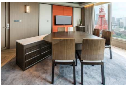
会議室も2時間まで無料でご利用可能。気分転換に場所を変えることも。