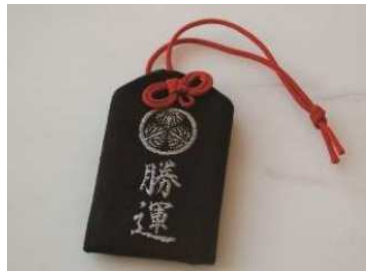
増上寺の「勝運御守」をプレゼント