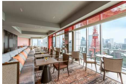
プレミアムクラブフロアにご宿泊者のみ利用できるプレミアムクラブラウンジ。