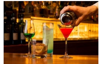
メインバー ウインザー (カクテルイメージ)

※レストラン商品に記載の料金には消費税が含まれております。別途10%サービス料を頂戴いたします。