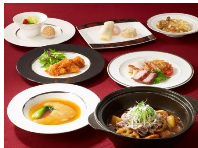
リニューアル記念メニュー(イメージ)

【提供時間】 5:00P.M.～9:30P.M. (ラストオーダー 9:00P.M.)