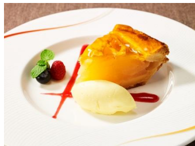
アップルパイ ア・ラ・モード

【提供時間】 11:00A.M.～9:00P.M. (ラストオーダー 8:30P.M.)