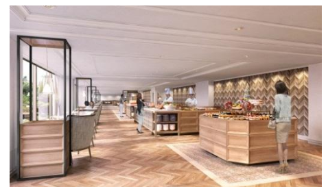
ブッフェレストラン(イメージ)