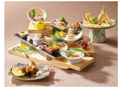
和食 清水 プリフィクスディナー (イメージ)