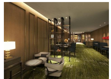
新設のクラブラウンジ(イメージ)

全462室の客室を3つのフロアカテゴリーに分けてクラブフロアを新設いたします。また、専用のクラブラウンジを新設するほか、ブッフェレストランを活気あふれるダイニングとしてリニューアル。ロビー(1F)も伝統の中に華やかさを感じられるデザインを取り入れ、お客さまをお迎えいたします。