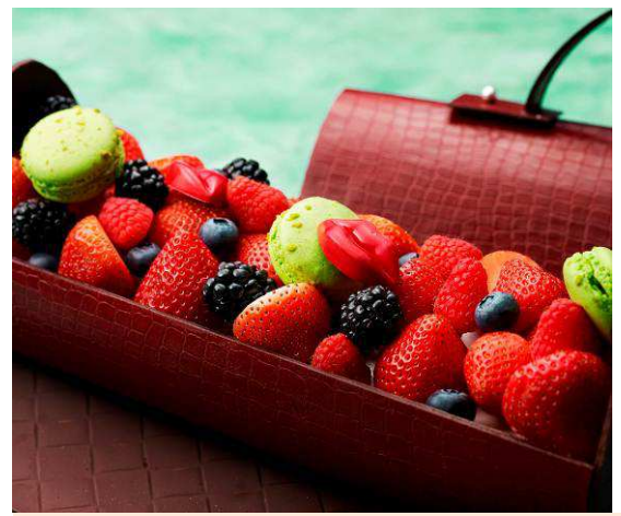
バッグを開けると中からベリーやマカロンとともにオペラが現れます。

【商品名】 「POUR MA CHERE」 (プール マ シェル) ※限定 20 個