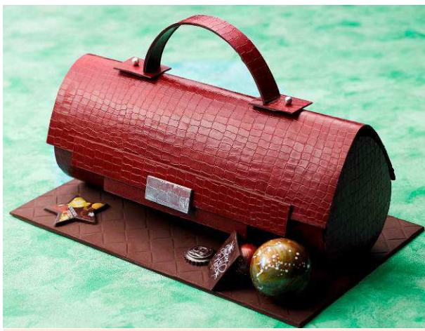
チョコレート細工で作られたレザーバッグ型のケーキ

クリスマスに欠かせないアイテムの一つがプレゼント。大切な人の喜ぶ顔を想像しながら選んだり、貰って包みを開く瞬間などのクリスマスのワクワク感を表現するため、プレゼントのバッグをそのままケーキにいたしました。ホテルのパティシエが丁寧に作るチョコレート細工のシックな色のレザーバッグを開けると、中にはベリーやマカロンでカラフルに彩られたオペラケーキが現れます。「大切な人へ」贈るプレゼントとしておすすめの一品です。