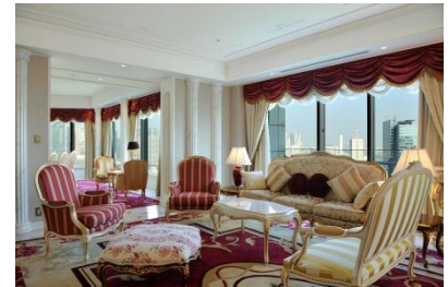
ハーバーロイヤルスイートルーム (リビングルーム)

18世紀フランス・ルイ15世時代をイメージしたインテリアで彩られた約220㎡の「ハーバーロイヤルスイートルーム」は、専属バトラーのフルサービスによりお好みのスタイルでお過ごしいただける特別ルームです。リビングルームからは東京湾やレインボーブリッジなどを一望いただけます。