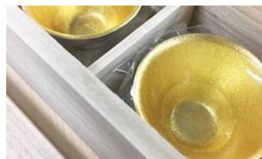
錫製お猪口(イメージ)