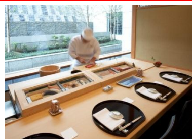
板前が目の前で握る寿司を 楽しめるプライベートカウンター