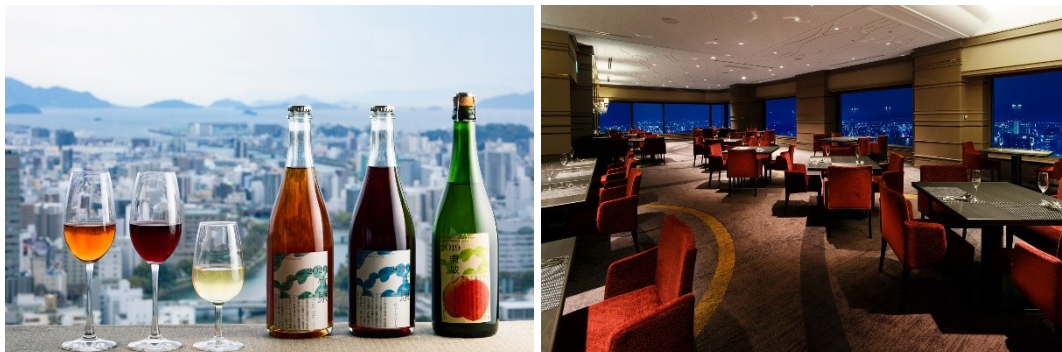
[左]ワインイメージ [右]スカイダイニング リーガトップ(店内)