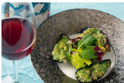
ムール貝 香草バター風味(イメージ)