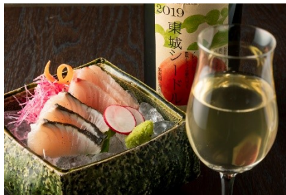
瀬戸内産鱈の2種のお楽しみ(イメージ)