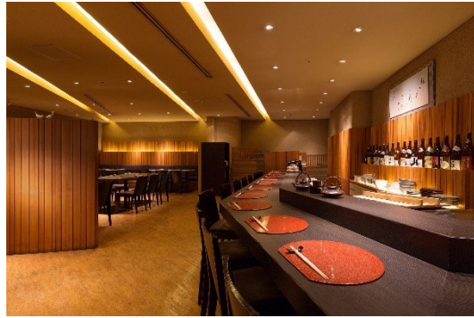
[左]広島県産赤鶏の天婦羅と野菜の素揚げ ちよだの卵の黄身醤油仕立て(イメージ) [右]寿司 旬菜 酒仙(店内)

【時間】 17:30～21:00(ラストオーダー 20:00) [定休日:火曜日]