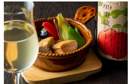
広島県産豚肉のやわらか煮 塩味仕立て 柚子胡椒添え(イメージ)