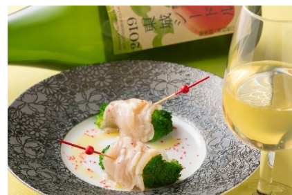
ニジマスのスモークとブロッコリーソテー アンチョビソース(イメージ)