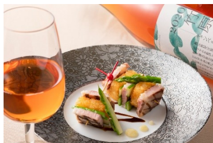
広島県産豚肉の網焼き ポテトのミルフィーユ仕立て 塩レモン風味(イメージ)