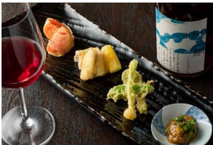
倉橋町で採れたキングトマトと 瀬戸内穴子の天婦羅(イメージ)