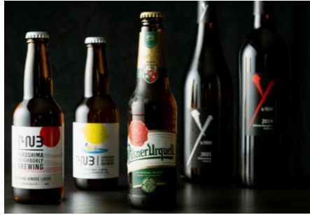
ドリンク (イメージ)