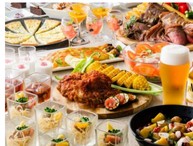
ビュッフェ (イメージ)

ヤンニョムチキンとオニオンリング / タコ入りチヂミ / アンチョビ入り焼きポテトサラダ / アボカドのコチュジャン和え / サラミソーセージと冷製胡瓜のアヒージョ / 魚のカルパッチョ(土日祝ディナーのみ) / サラダ / パン ほか