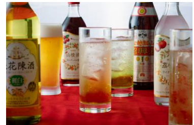
フリードリンク (イメージ)