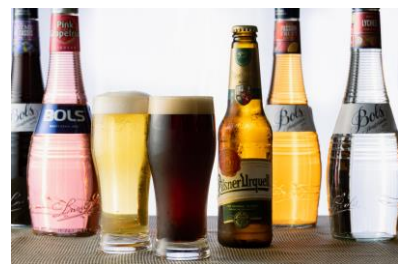
フリードリンク (イメージ)