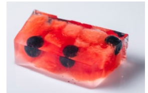
スイカのゼリー (イメージ)