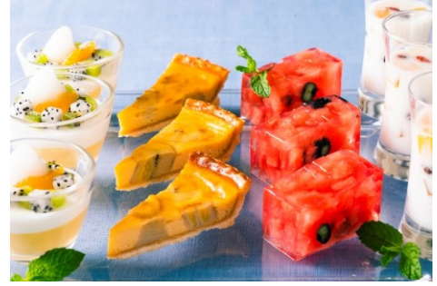
スイーツビュッフェ (イメージ)