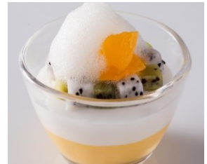
マンゴーとココナッツのムース (イメージ)