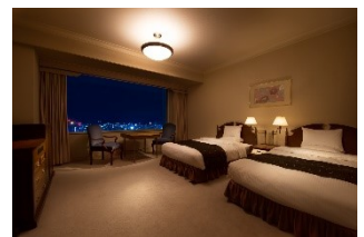
スタンダードフロアツイン 34㎡ (イメージ)