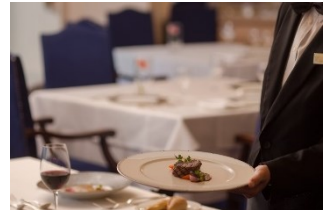
レストラン イメージ