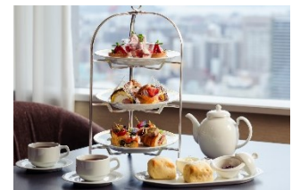
アフタヌーンティーセット(イメージ)