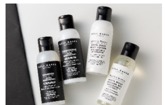
バスアメニティ(イメージ)