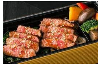
ステーキ弁当(イメージ)