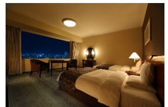
スーペリアフロアツイン (イメージ)