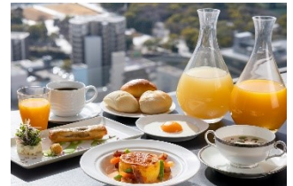
エグゼクティブフロア特別朝食 (イメージ)