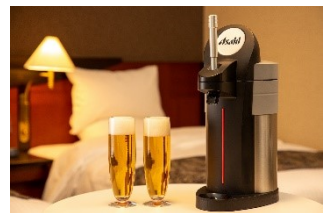
卓上ビアサーバー (イメージ)

※1日5室限定 ※ビアサーバー付プランのため、ご利用は20歳以上とさせていただきます。 ※ビアセットはお部屋にお届けいたします。 ※卓上ビアサーバーは2,500円で1ℓのお替わりを承ります。 ※広島県の要請等により、提供時間を変更する場合がございます。 ※朝食会場はお日にちにより、変更する場合がございます。