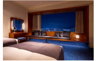
エグゼクティブフロアツイン (イメージ)