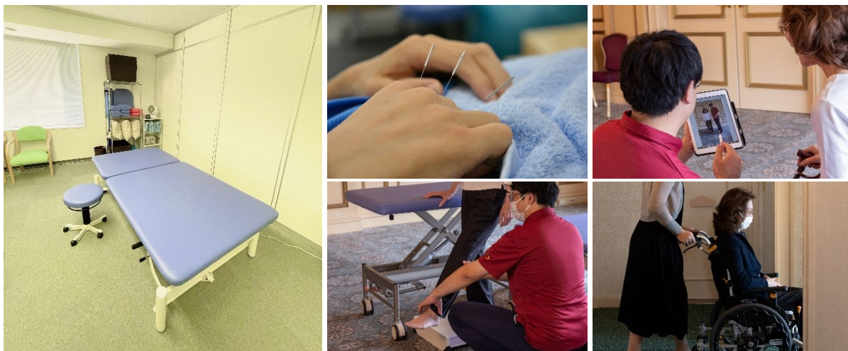
リハビリルーム(イメージ)