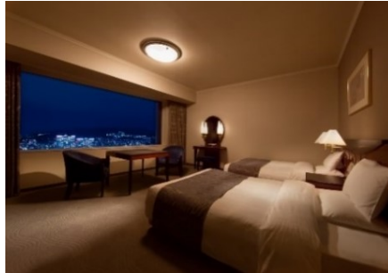
スタンダードフロア イメージ(38㎡)