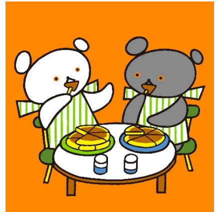
『しろくまちゃんのほっとけーき』(こぐま社)より ©わかやまけん