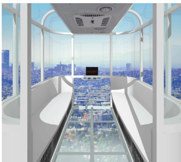
ゴンドラ(定員 6 名)イメージ