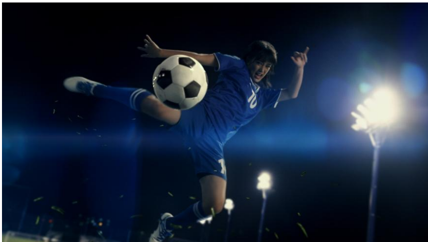
「バーバースガ・自由化ショット」篇 CMカットより

東京ガス株式会社は、ドラマや映画など多方面で活躍中の妻夫木聡さんとモデルで若手実力派女優の広瀬すずさんを起用し、2016年の「電力自由化」に向けて、「マイ電気は、東京ガス。」をメッセージとした新CMを制作致しました。「バーバースガ・自由化ショット」篇を2016年1月1日（金）より、「バーバースガ・まとめて」篇を2016年1月4日（月）より放送開始致します。また、特設ウェブサイト（ http://tg-power.jp/comic ）では、同CMと、CM内で披露される高橋陽一先生の描き下ろし漫画「副キャプテン自由化」を公開します。